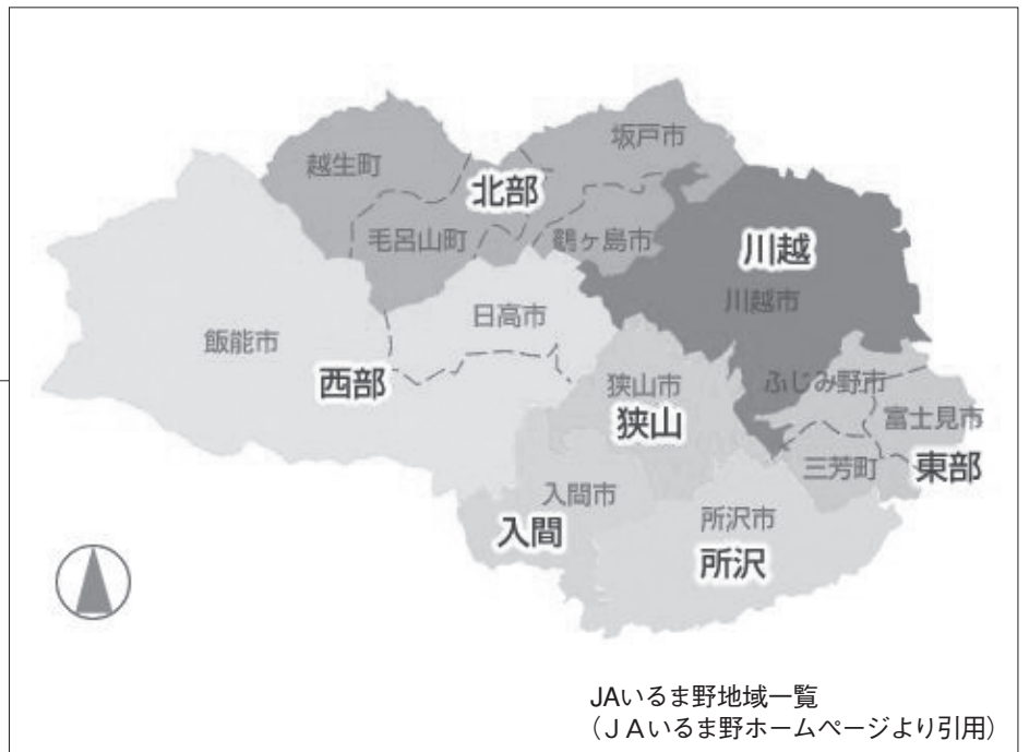
JAいるま野地域一覽 (JAいるま野ホームページより引用)

約5万人を擁し、従事する職員数はおよそ14000人を数える、大きな金融機関でもある。銀行など通常の金融機関が兼業を厳しく制限されているのに対し、JAは特権として金融を含む幅広い業務を行うことができる。