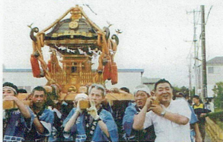
川越市内各地の夏祭りに参加

7月31日に、入間市の農林総合研究センター茶業研究所で、「狭山茶摘み体験フェスタ2014」が開催され参加。