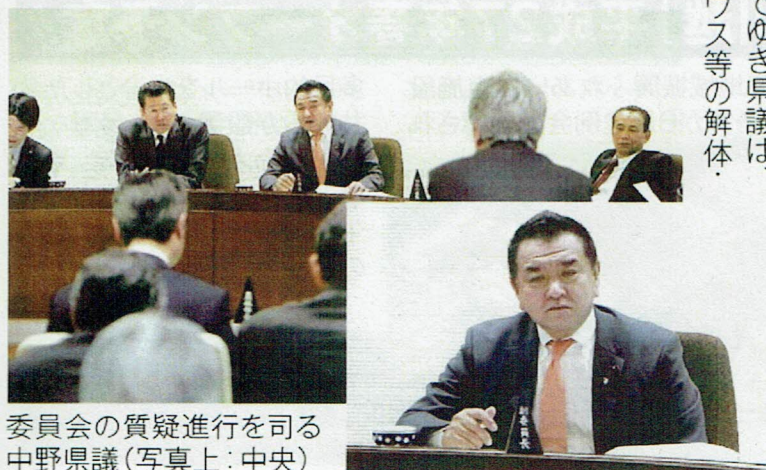
委員会の質疑進行を司る中野県議(写真上:中央)