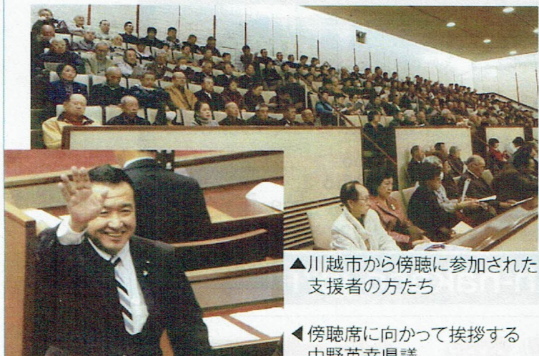
▲川越市から傍聴に参加された支援者の方たち

【企画財政部長答弁】県では、地域特性に合ったデマンド交通が導入できるよう、先行事例の情報提供などを行い、市