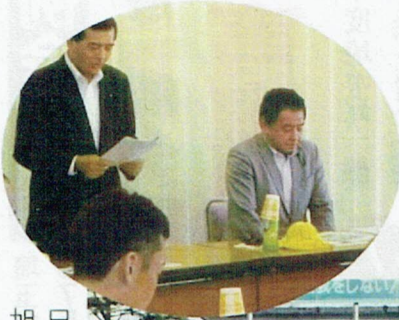
日本製紙北海道工場 旭川事業所も視察。

農産物の生産と加工・販売の一体化や、地域資源を活用した新たな産業創出に取り組む南アルプス市の農業の6次産業化の推進について意見交換。