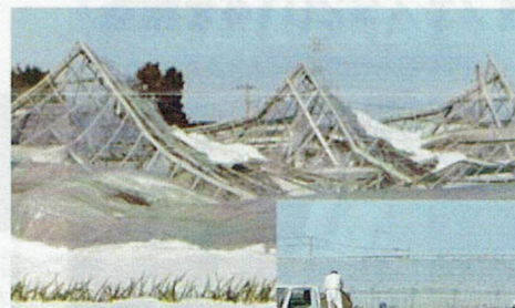
大雪でつぶされたビニールハウス