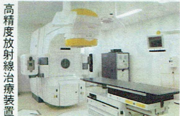
高精度放射線治療装置