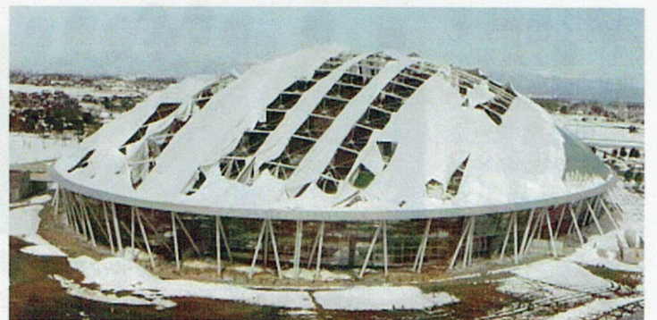
積雪の重みで屋根が倒壊した彩の国くまがやドーム