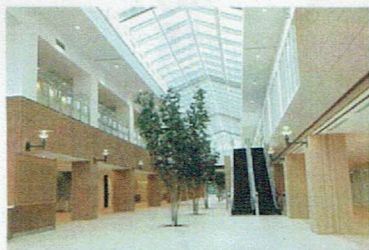
太陽光発電併用半透明ガラスを採用 明るく爽やかなホスピタルストリート