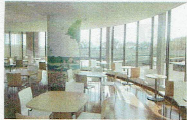
コミュニティラウンジ