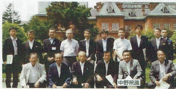
北海道庁を訪問。意見交換を行う。

神内ファームでは、赤毛和牛の飼育やパイナップルなどの南国フルーツへの挑戦の説明を受ける。