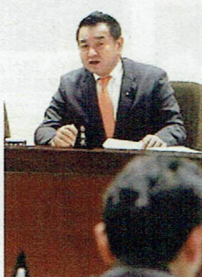
企画財政委員長として議事進行を司る中野県議

企画財政常任委員会では、県一般会計の歳入に関する事項をはじめ、県行政の総合的企画や調整を行い、行政改革・地方分権の推進・市町村の行財政の充実・地域の総合的な整備推進など多岐にわたる重要な事項を審査いたします。