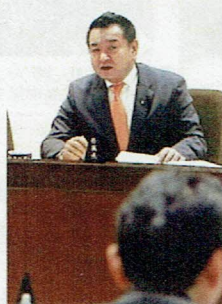
企画財政委員長として議事進行を司る中野県議

企画財政常任委員会では、県一般会計の歳入に関する事項をはじめ、県行政の総合的企画や調整を行い、行政改革・地方分権の推進・市町村の行財政の充実・地域の総合的な整備推進など多岐にわたる重要な事項を審査いたします。