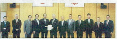
新川越越生線建設促進に関する県知事への要望活動(右端)