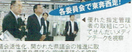
優れた指定管理者の取組についてぜひメディアアタックを視察