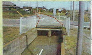
H28年度予定箇所(電柱復旧)