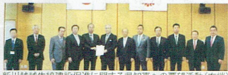
新川越越生線建設促進に関する県知事への要望活動(右端)