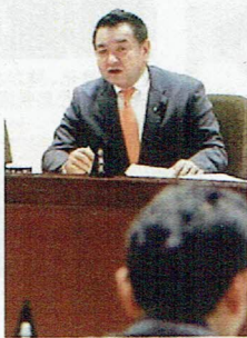
企画財政委員長として議事進行を司る中野県議

企画財政常任委員会では、県一般会計の歳入に関する事項をはじめ、県行政の総合的企画や調整を行い、行政改革・地方分権の推進・市町村の行財政の充実・地域の総合的な整備推進など多岐にわたる重要な事項を審査いたします。