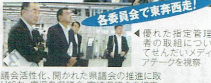
優れた指定管理者の取組についてぜひメディアアタックを視察