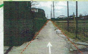
H27年度工事箇所(用水路改修)