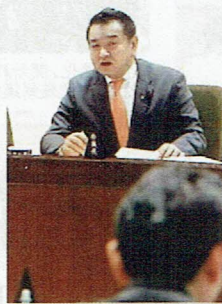
企画財政委員長として議事進行を司る中野県議

企画財政常任委員会では、県一般会計の歳入に関する事項をはじめ、県行政の総合的企画や調整を行い、行政改革・地方分権の推進・市町村の行財政の充実・地域の総合的な整備推進など多岐にわたる重要な事項を審査いたします。