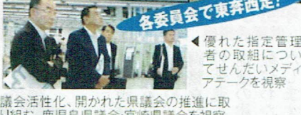
優れた指定管理者の取組についてぜひメディアアタックを視察