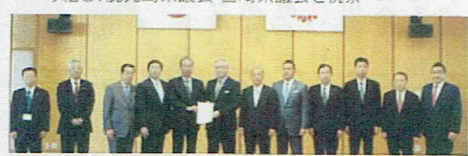
新川越越生線建設促進に関する県知事への要望活動(右端)